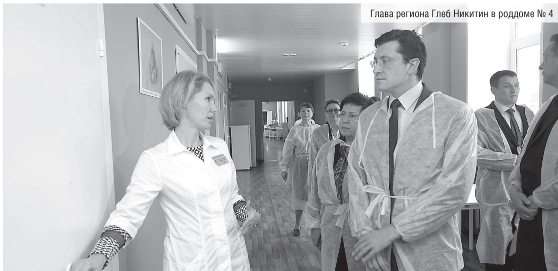
Глава региона Глеб Никитин в роддоме № 4

По итогам обсуждения этого вопроса Глеб Никитин заявил, что внутриутробное переливание крови плоду, которое планируется освоить в Нижегородской области в 2018 году, это лишь один из примеров внедрения высокотехнологической медицинской помощи и современных методик в нижегородских роддомах.