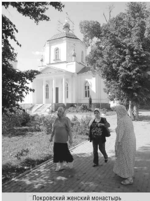
Покровский женский монастырь