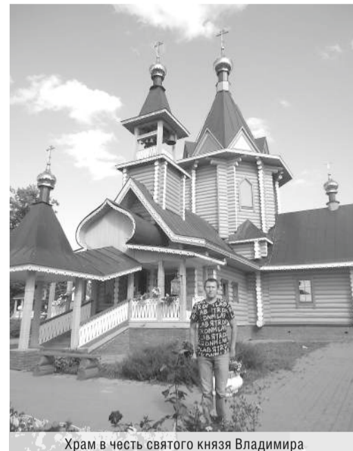
Храм в честь святого князя Владимира