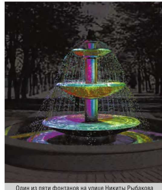
Один из пяти фонтанов на улице Никиты Рыбакова