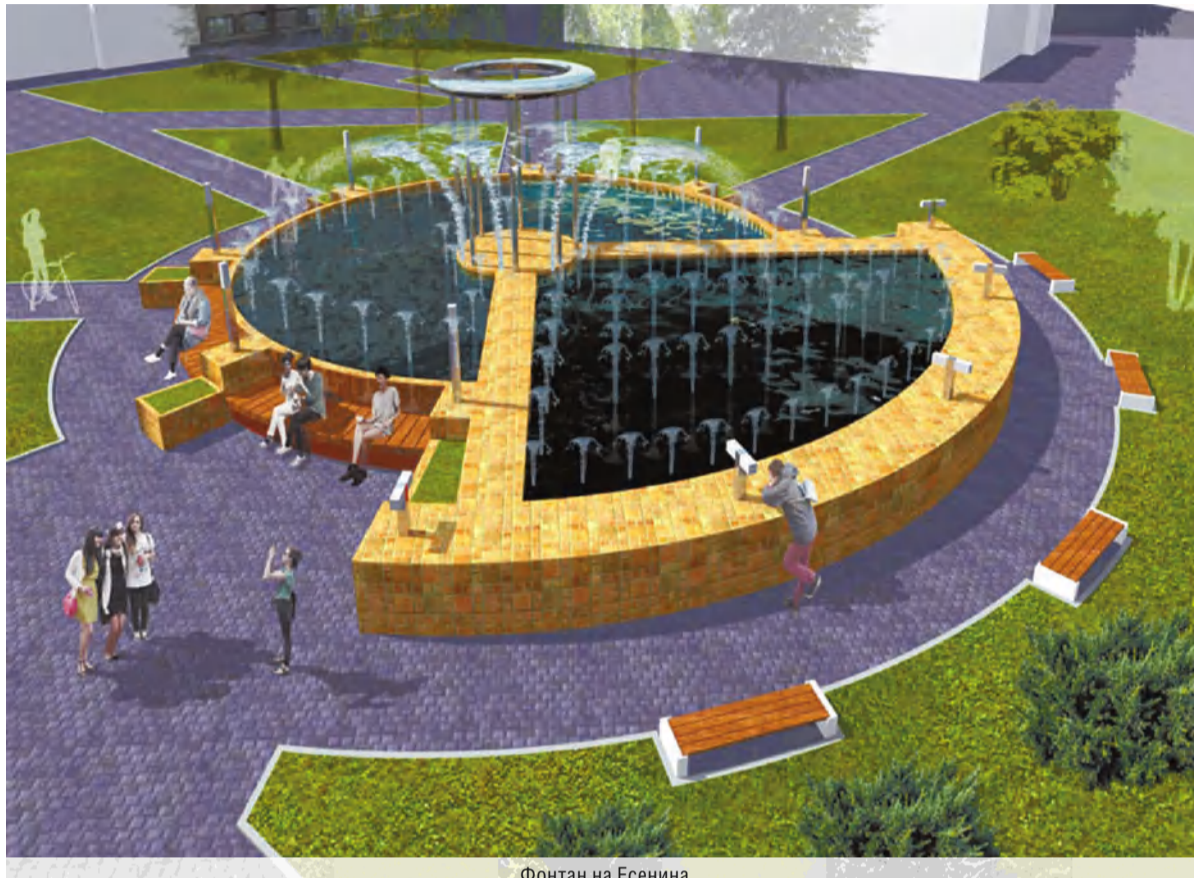
Фонтан на Есенина