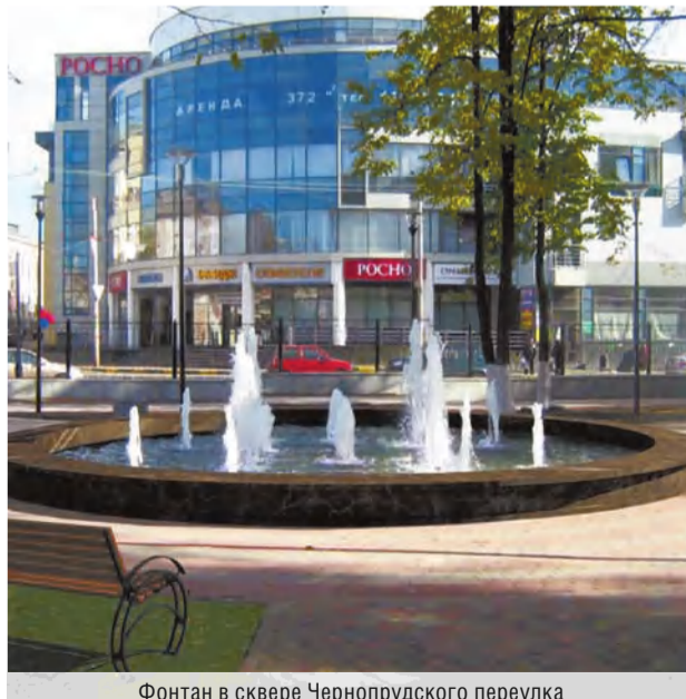
Фонтан в сквере Чернопрудского переулка

Елена Шаповалова