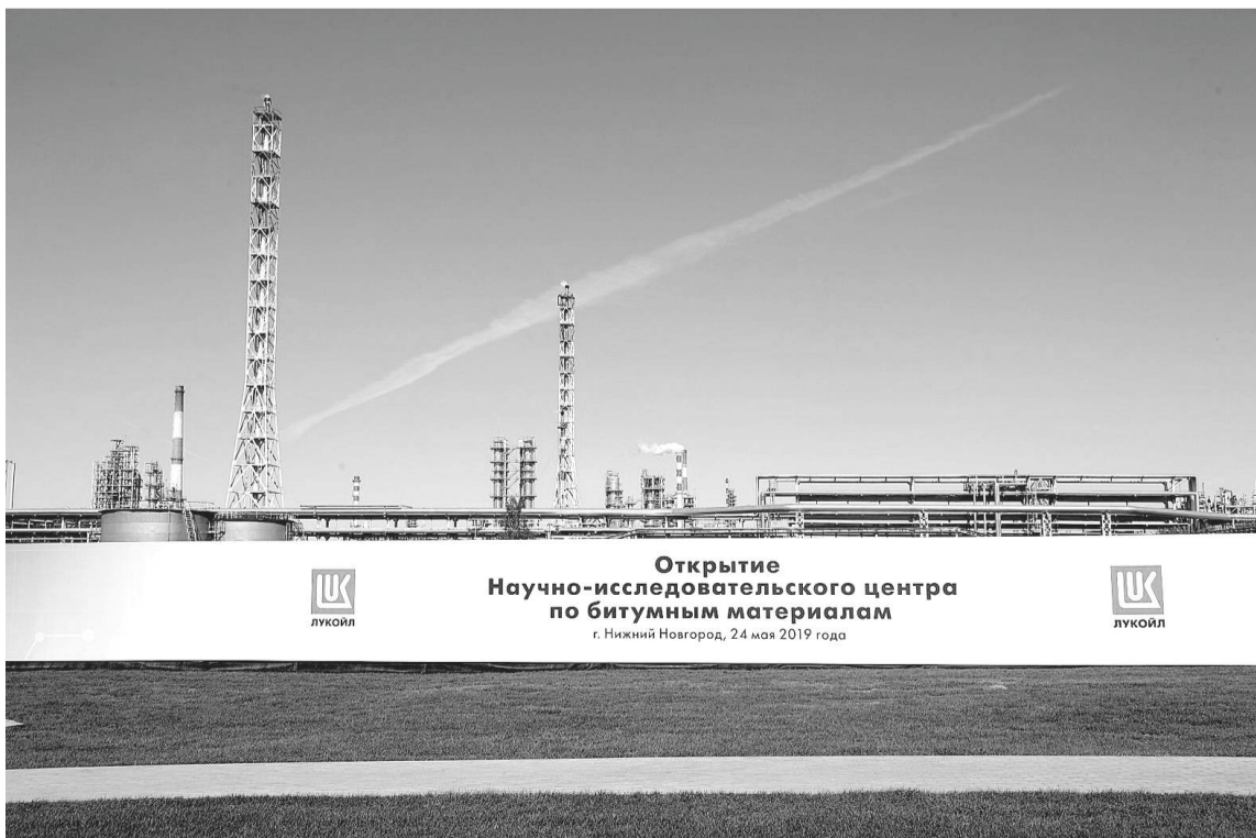
Открытие Научно-исследовательского центра по битумным материалам г. Нижний Новгород, 24 мая 2019 года

Дарья Светланава