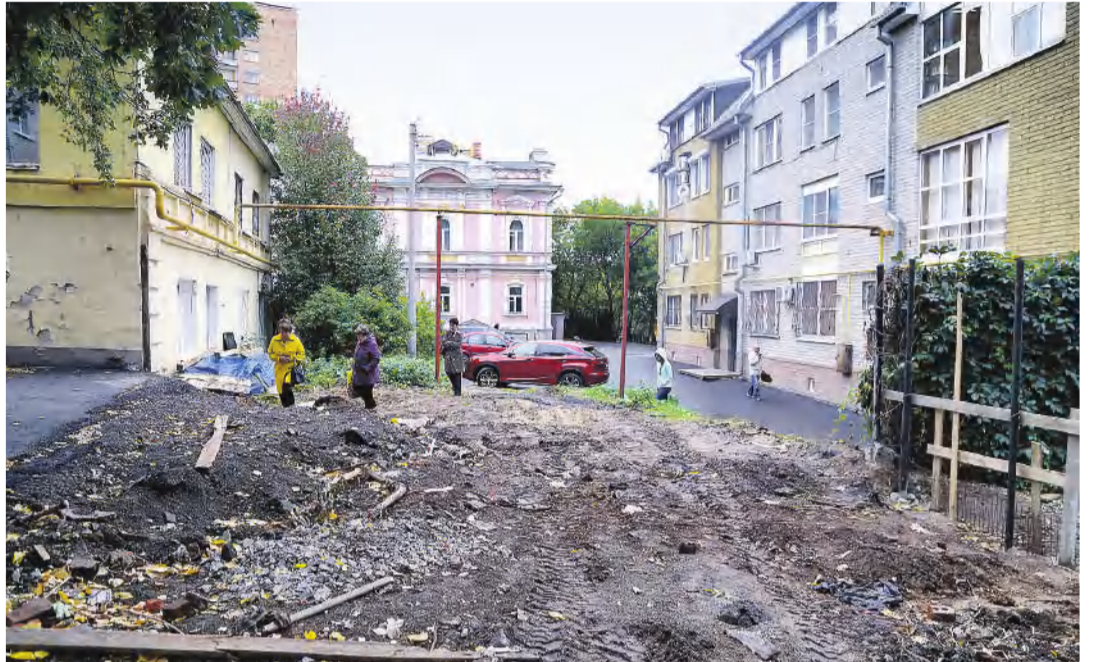
Дворы на Ильинке нуждаются в благоустройстве

Анна Сингосина