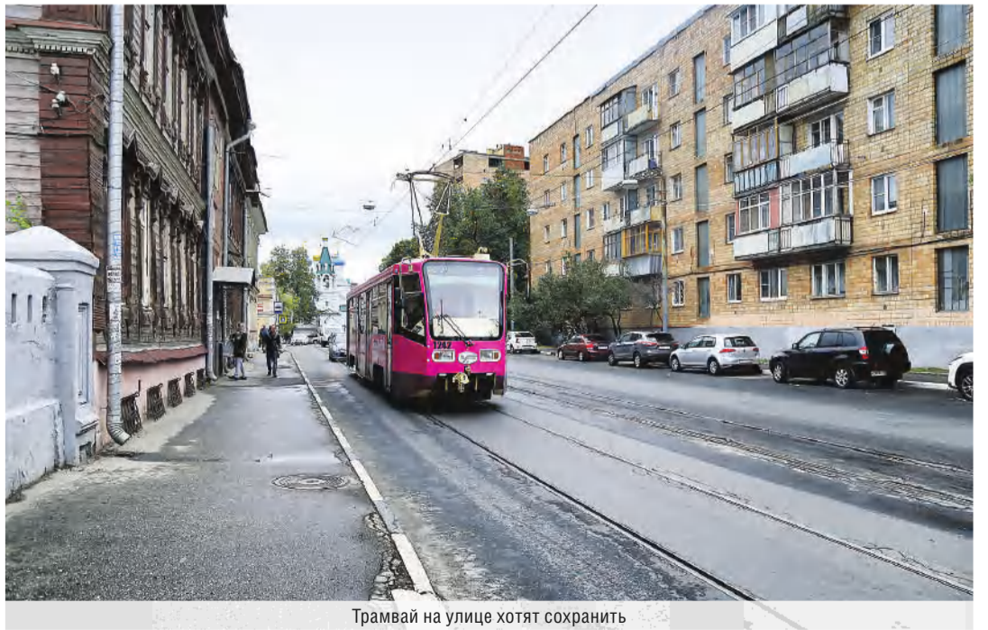
Трамвай на улице хотят сохранить