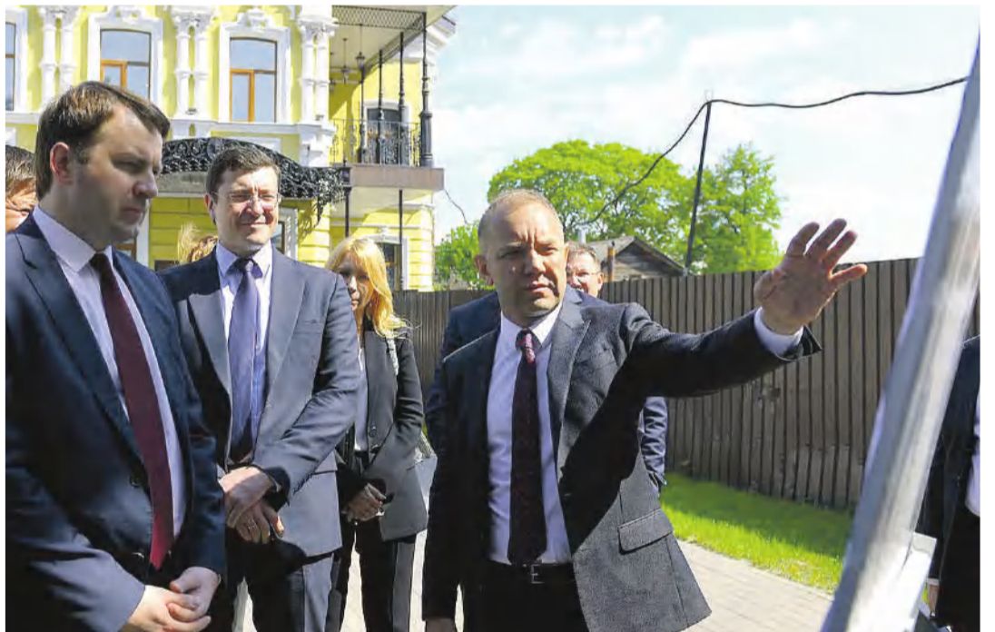
После редевелопмента Ильинка станет удобнее