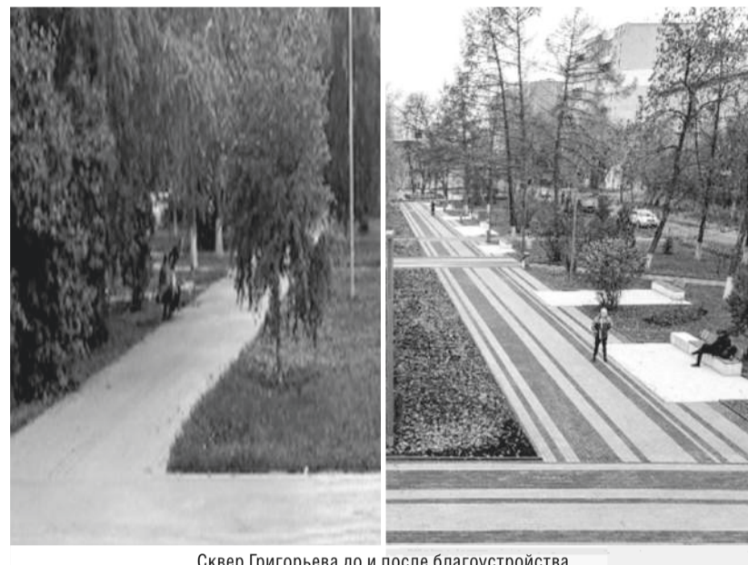
Сквер Григорьева до и после благоустройства

Подготовила Анна Сингосина