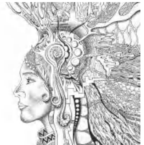
Подготовила Елена Крюкова.