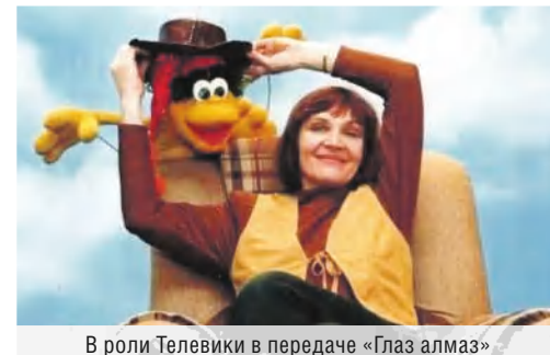
В роли Телевики в передаче «Глаз алмаз»