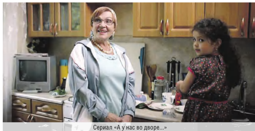
Сериал «А у нас во дворе...»