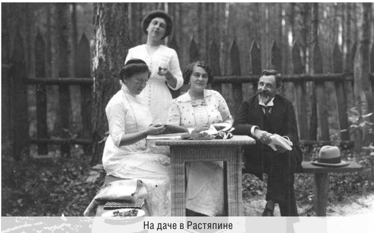
На даче в Растяпине