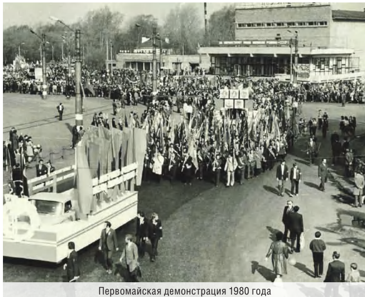
Первомайская демонстрация 1980 года