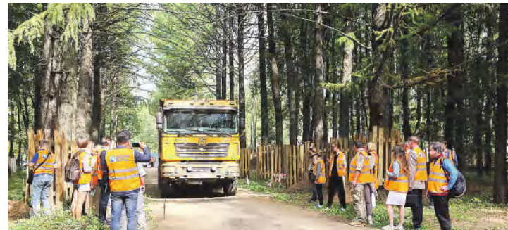
Огорожено около 3000 деревьев в зоне проведения работ, подготовлено песчаное основание пяти площадок, где запланировано строительство комплекса кафе, воркаут-зоны, читальни, центра обучения доступной среды и детской площадки