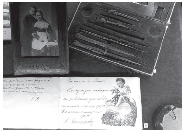
Подготовила Дарья Светланова.

И конечно, никого не оставит равнодушным коллекция маленьких фарфоровых фигурок, изготовленных на российских и западноевропейских заводах, изображающих непосредственно-милые детские образы. (6+)