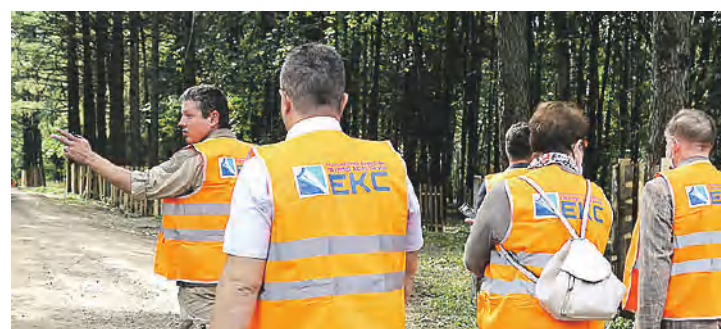
Подрядчик учитывает в работе мнение экологов. В частности, обрабатываются садовым варом корни деревьев, а при обратной засыпке грунта рабочие добавляют удобрения, стимулирующие рост корней