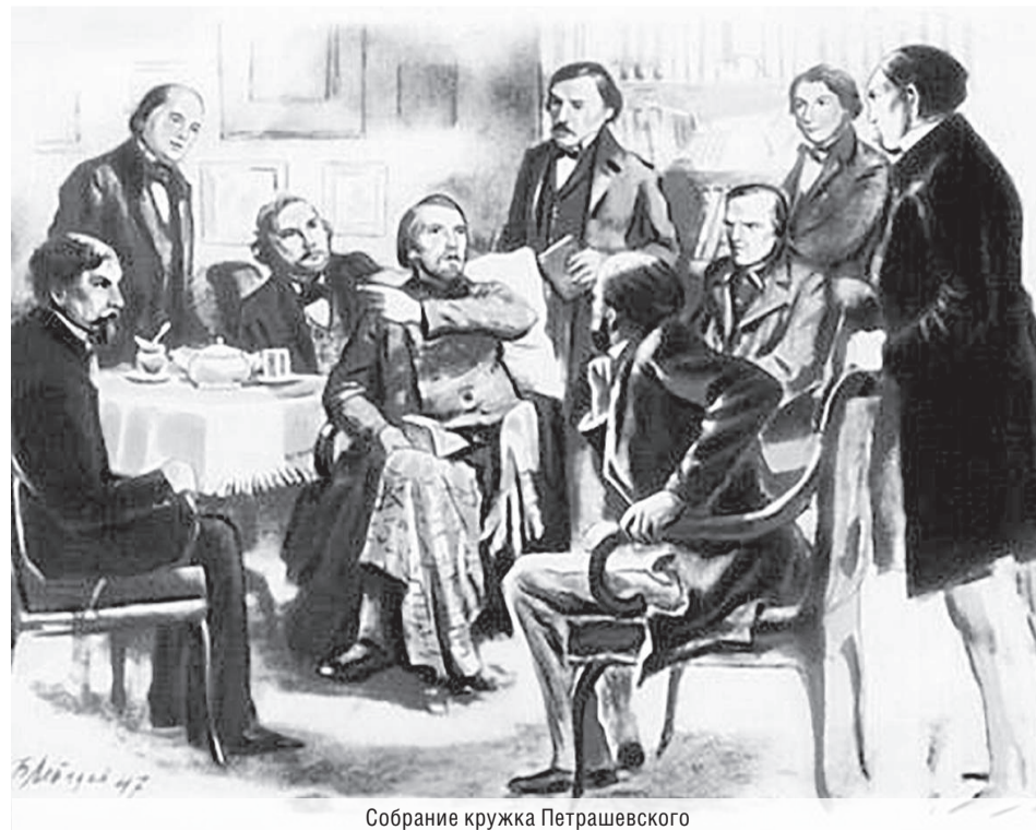
Собрание кружка Петрашевского

В 1846 году вышел первый сборник произведений поэта. В него вошли стихотворения «Вперед! без страха и сомненья...» и «По чувствам братья мы с тобой». Стихи Плещеева были популярны в среде революционно настроенной молодежи, их называли «Марсельезой» поколения 1840-х.