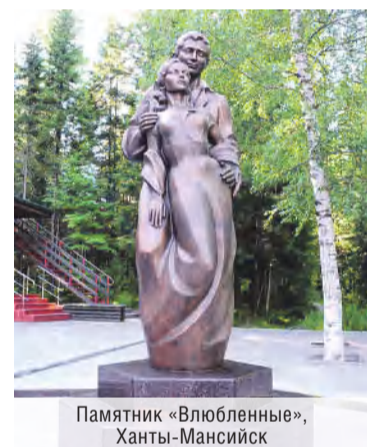
Памятник «Влюбленные», Ханты-Мансийск