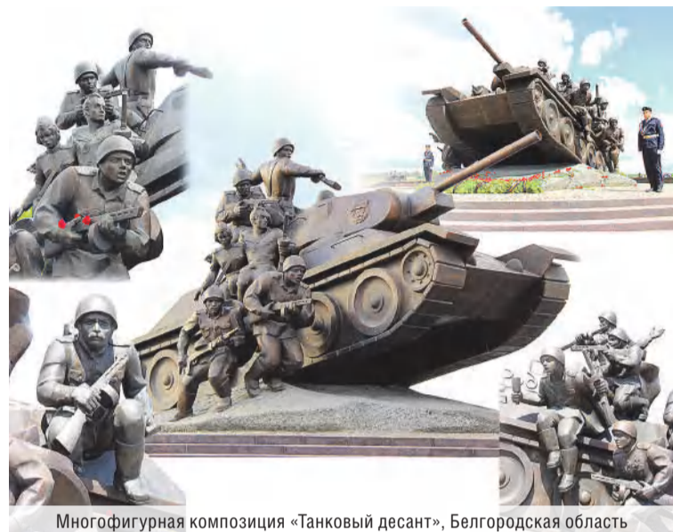
Многофигурная композиция «Танковый десант», Белгородская область

– Действительно, в настоящее время идет конечный этап работы. У нас еще достаточно времени. Думаю, что в январе 2021 года бюст будет завершён и ста-