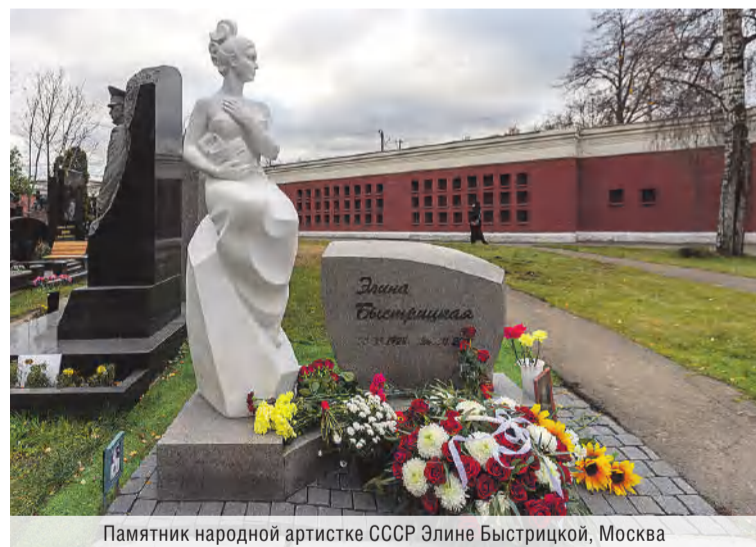
Памятник народной артистке СССР Элине Быстрицкой, Москва

нет дожидаться своего часа. А предстоящей весной отправим скульптуру в ваш город.