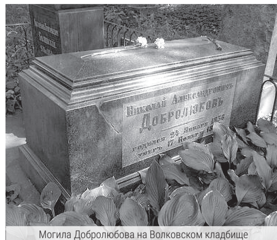
Могила Добролюбова на Волковском кладбище

Имя Николая Александровича Добролюбова – пожалуй, одного из наиболее талантливых и знаменитых наших земляков – хорошо знакомо всем учившимся в советской школе. Его фигура была окружена официальным почитанием в СССР. В этой статье мы предпримем свою попытку приблизиться к пониманию, каким на самом деле был этот выдающийся уроженец Нижнего Новгорода.