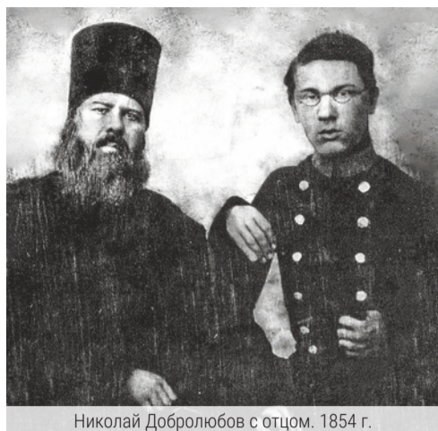
Николай Добролюбов с отцом. 1854 г.