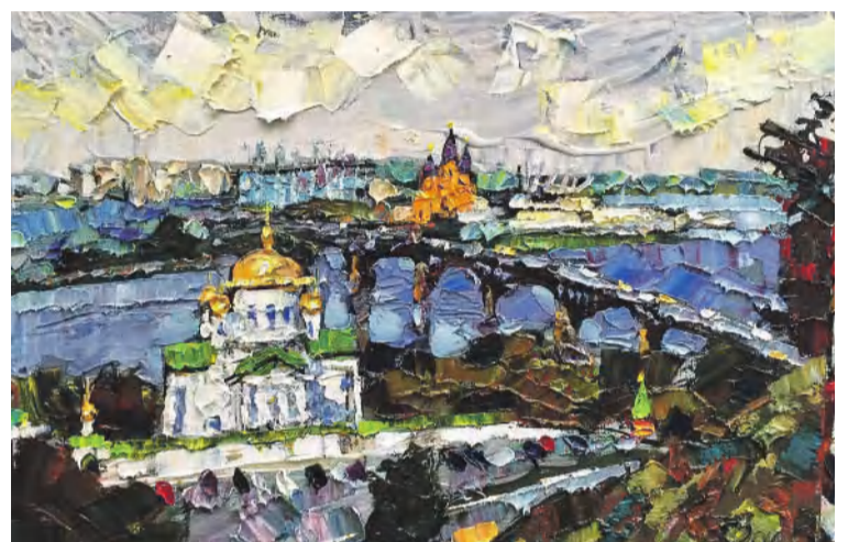
«Канавинский мост». Михаил Поляков