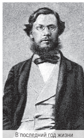
В последний год жизни