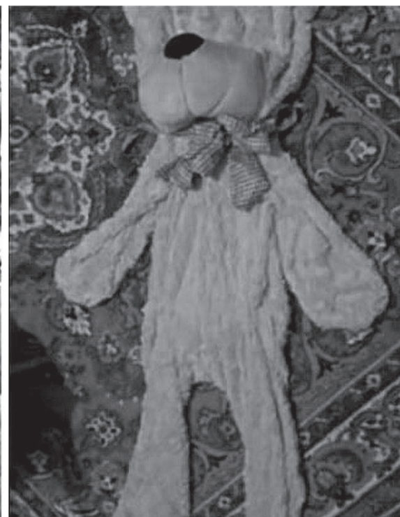
А такую покупку принес курьер после заказа

— Разрешение имущественных споров, связанных с неисполнением иностранной компанией своих обязательств, осуществляется в соответствии с нормами главы 68 Гражданского кодекса Российской Федерации, а пределы применения норм закона «О защите прав потребителей» определяются в статье 1212 ГК РФ, — объясняют в ведомстве.