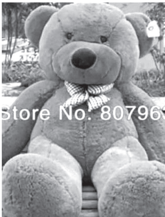
Так выглядел товар на фото в каталоге онлайн-магазина

Е сли товар, приобретенный в интернете, оказался некачественным, то покупатель может, как и при офлайн-торговле, требовать его замены на новый, снижения стоимости или возврата продавцу.