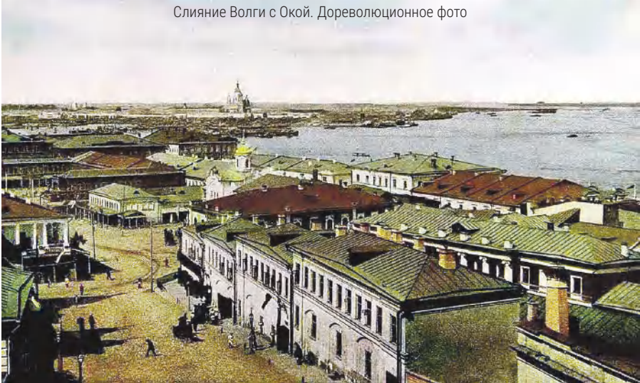
Слияние Волги с Окой. Дореволюционное фото

– Мой герой появится в Нижнем Новгороде, когда будет спасаться от ВЧК в 1918 году. Тогда закончится и карьера уголовного сыщика Лыкова. Он окажется между двух огней: между чекистами и повстанцами.