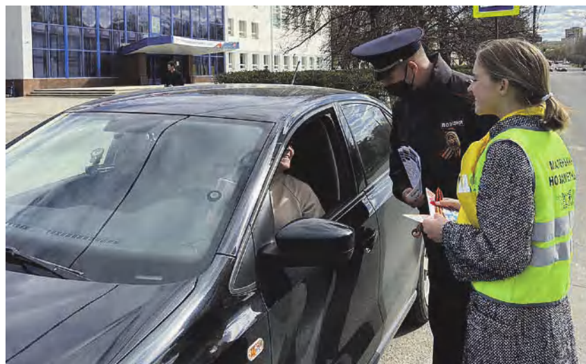
Подготовила Елена Сенникова

ственной безопасности, о безопасности своих детей и пожилых родственников, раздавая нижегородцам тематические брошюры, а юным нижегородцам – светоотражающие брелки и браслеты. Каждому участнику мероприятия вручена символическая ленточка черно-оранжевого цвета, которая в России стала символом военной доблести и славы. Нижегородская госавтоинспекция присоединяется к поздравлениям. Выражаем нашим ветеранам огромную благодарность за Великую Победу. Желаем им долгих лет жизни, всем мирного неба над головой, крепкого здоровья и безопасных дорог!