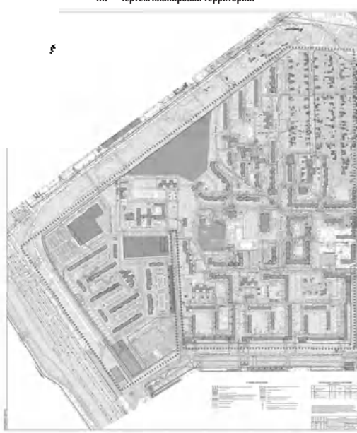
Министерство градостроительной деятельности и развития агломераций Нижегородской области