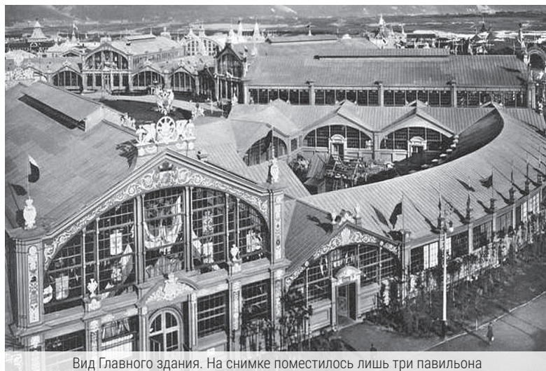
Вид Главного здания. На снимке поместилось лишь три павильона