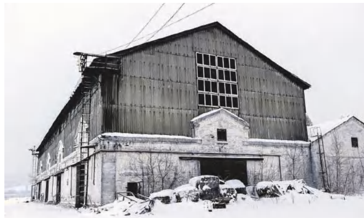
Таким был пакгауз на Стрелке.

– Каким образом удалось отстоять право на их существование?