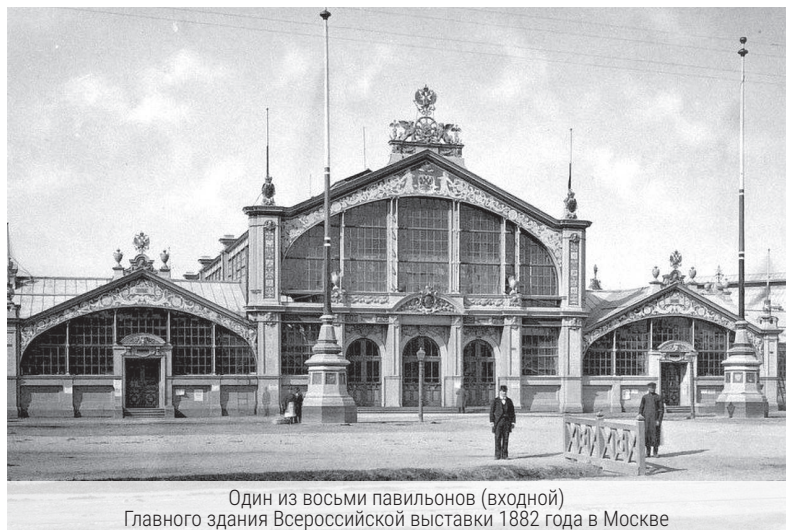
Один из восьми павильонов (входной) Главного здания Всероссийской выставки 1882 года в Москве

Все выставочные павильоны строились с нуля, за исключением одного – Главного, или, как его еще называли, Центрального здания. Оно единственное было не новым – в целях экономии, а она составила 300 тыс. рублей, посчитали целесообразным использовать Главное здание, сохранившееся в Москве от предыдущей Всероссийской выставки. Решено было металлический каркас, общий вес которого составлял 115 тыс. пудов (1840 т), разобрать и в Нижнем Новгороде вновь собрать.