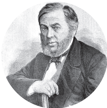
Александр Иванович Резанов

Известные в России архитекторы и инженеры трудились над проектом Главного здания. Общий план и проекты фасадов выполнял выдающийся архитектор Александр Иванович Резанов (1817–1887). Кстати, именно Резанов строил храм Христа Спасителя в Москве, а на нижегородской земле по его проекту возвели Свято-Троицкий собор Серафимо-Дивеевского монастыря.