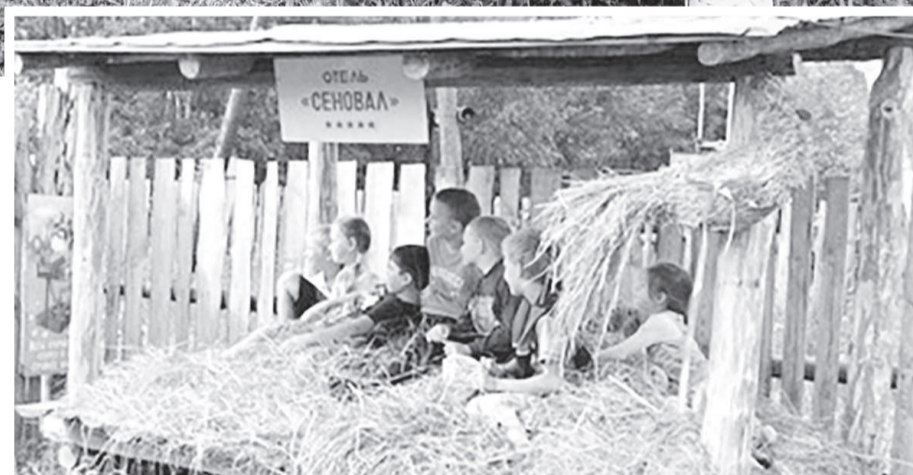
Отель Сенювал в Потешной деревне

Для любителей экзотики – страусиная ферма в деревне Новодмитриевке