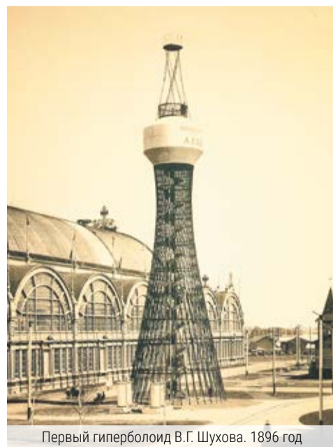
Первый гиперboloид В.Г. Шухова. 1896 год

Казалось бы, Владимир Григорьевич только и делал, что работал, львиную долю времени проводя за письменным столом. Но это не так, совсем не так. В том-то и состоит ренессансный тип личности: он любил и ценил жизнь в ее многообразии. Обожал театр, балет и классическую музыку, много читал, свободно владел тремя иностранными языками. Особое место в его жизни занимал спорт: Владимир Шухов играл и в теннис, и в шахматы, бе-