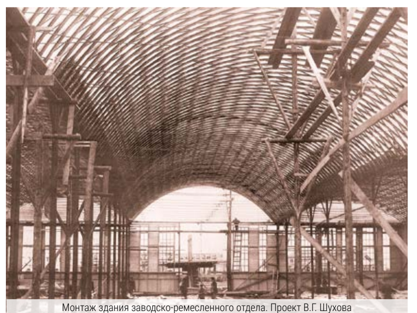
Монтаж здания заводско-ремесленного отдела. Проект В.Г. Шухова