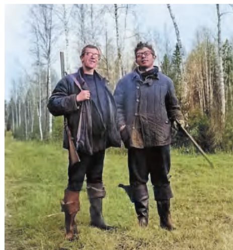
1973 год. С братом на охоте

– Я работал в студенческом отряде в Коми АССР. В республиканской газете «Ухта» опубликовал стихи и рассказ. Мне тогда было 20 лет. Когда приехал в родной Горький, понял, что надо публиковаться дальше. Пошел в редакцию газеты «Ленинская