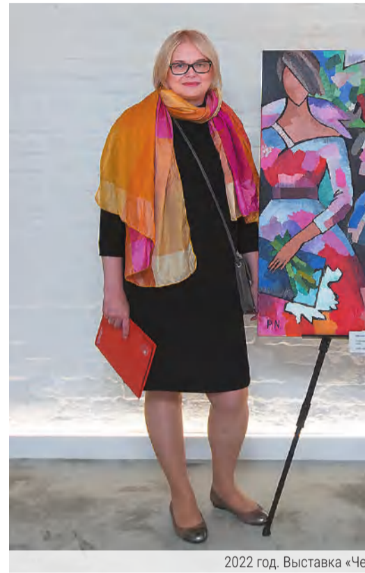
2022 год. Выставка «Че...

– Думаю, что манера моего письма – это экспрессионизм, но в позитивных тонах. Я пишу только тогда, когда мне хорошо. Свои плохие периоды не хочу сохранять в жизни. Для меня это спасение. Я создала свой мир, в котором мне комфортно.