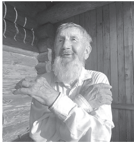
Старообрядец из деревни Клопиха Семеновского района