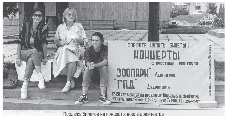
Продажа билетов на концерты возле драмтеатра