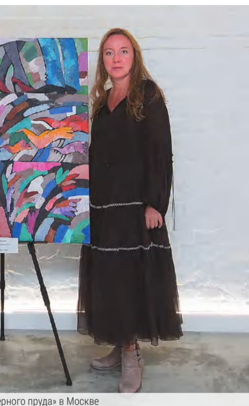
«...ного пруда» в Москве