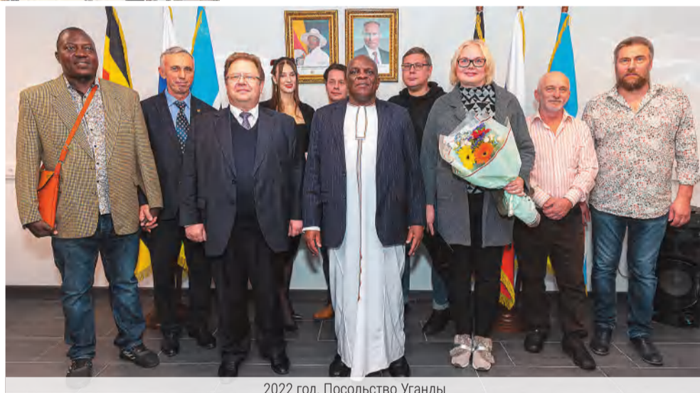
2022 год. Посольство Уганды

– У нас сейчас очень сложное время, но для художников оно хорошее. В городе одновременно проходит много интересных выставок. В НГХМ сейчас несколько корпусов: в Кремле, на Верхневолжской набережной, Манеж, Пакгаузы, «Современное искусство» на площади Минина. У художников есть возможность не только выставить свои работы, но и увидеть мировые