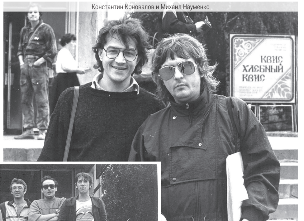
Константин Коновалов и Михаил Науменко

Ваш покорный слуга присутствовал на первом и последнем концертах Майка в Горьком. И даже взял автограф у Майка. В 1988 году «Зоопарк» получил официальное признание. Всесоюзная фирма грамзаписи «Мелодия» выпустила виниловую пластинку группы «Белая полоса». Выпуск диска-гиганта на «Мелодии» автоматически переводил музыкантов в высшую категорию исполнителей в нашей стране. ...В концовке четвертого концерта в Горьком музыканты «Зоопарка» и ГПД устроили совместный джем-сейшен. (Джем-сейшен (от англ. jam session) — совместная импровизация на заданную тему. Музыкальное дей-