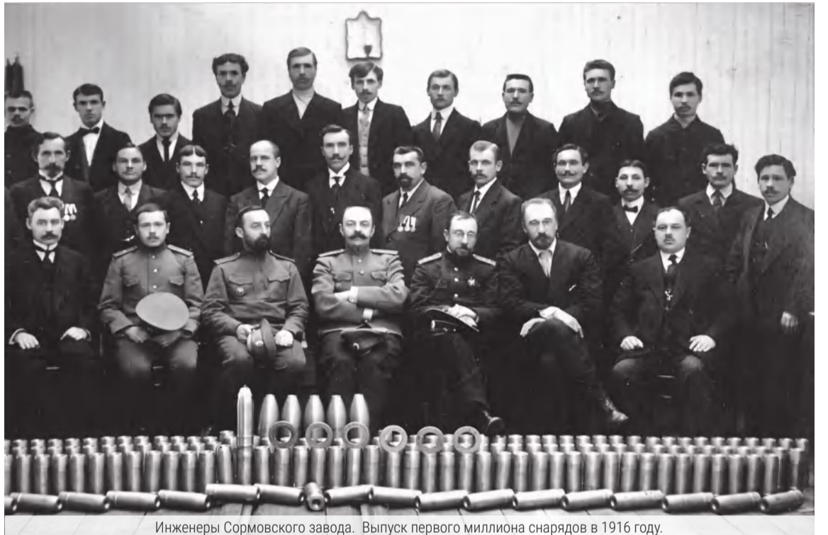
Инженеры Сормовского завода. Выпуск первого миллиона снарядов в 1916 году.