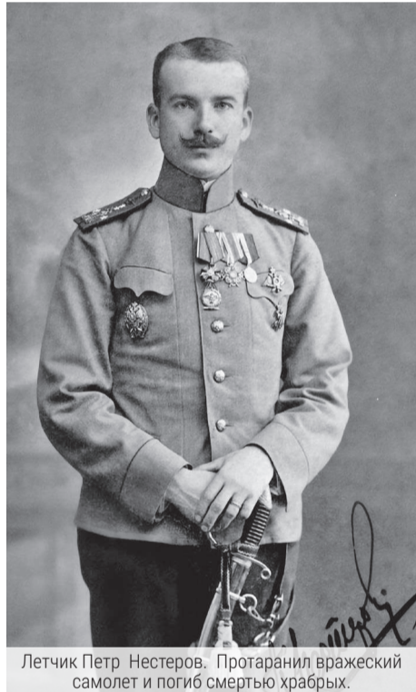
Летчик Петр Нестеров. Протаранил вражеский самолет и погиб смертью храбрых.

Дума Нижнего Новгорода провела экстренное заседание. Городской голова Дмитрий Сироткин зачитал текст телеграммы с изъявлением верности императору. Были предложены срочные меры, включая формирование городского военно-санитарного поезда, образование дамского комитета для заготовки белья и других предметов для нужд армии, выделение земству кредита в 10 000 рублей на проведение мобилизации, определение помещений для размещения раненых. Для обеспечения порядка принято решение закрыть питейные заведения. Они открылись снова только после окончания Гражданской войны.