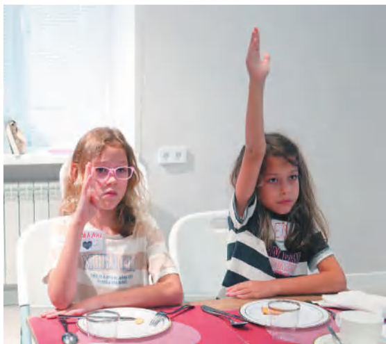
Фото творческого объединения «Восторг»