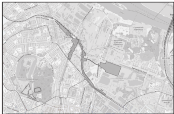
Схема границ подготовки документации по внесению изменений (арх. № 58/24)

к приказу министерства градостроительной деятельности и развития агломераций Нижегородской области от 1 апреля 2024 г. № 06-01-02/23