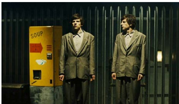
Кадр из фильма «Двойник» (2013 год)

Эта мистическая (ли?) повесть вышла в один год с «Бедными людьми», хоть и написана была чуть позже. В центре повествования — очередной «маленький человек». В жизнь героя вторгается... он сам, только в более успешной версии. После чего она, жизнь, будет безжалостно погублена.