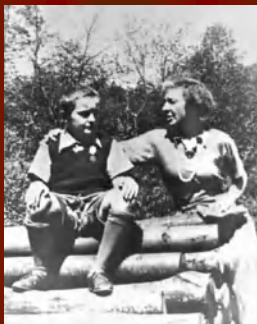
С сыном Георгием