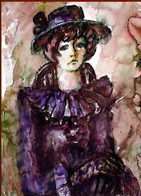
Борис Мессерер «Портрет Беллы Ахмадулиной»