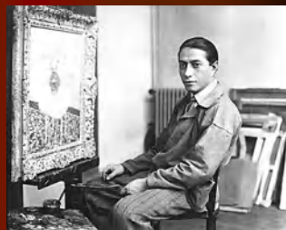
Натан Альтман «Портрет Анны Ахматовой»