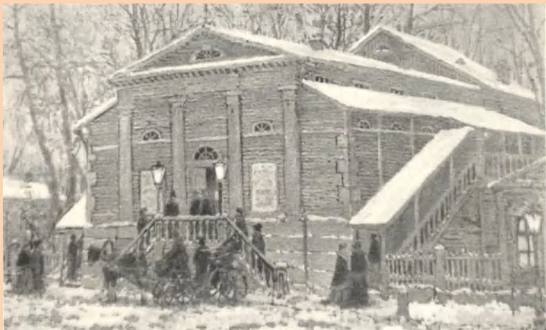
Крепостной театр князя Шаховского, построенный в 1811 году

Драматический театр Нижнего Новгорода имени М. Горького входит в число старейших театров страны. Он существует более 200 лет. Это был крепостной театр, и все актёры происходили из семей крепостных. Спектакли демонстрировались в одном из домов князя, который