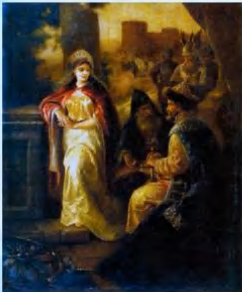
Владимир и Рогнеда. Художник А. И. Транковский

Новая религия потребовала морально-этических норм: гуманного отношения к женщине, к детям, моногамии в браке. Укрепилась семья. Возникло понятие о государе, «поставленном от Бога»