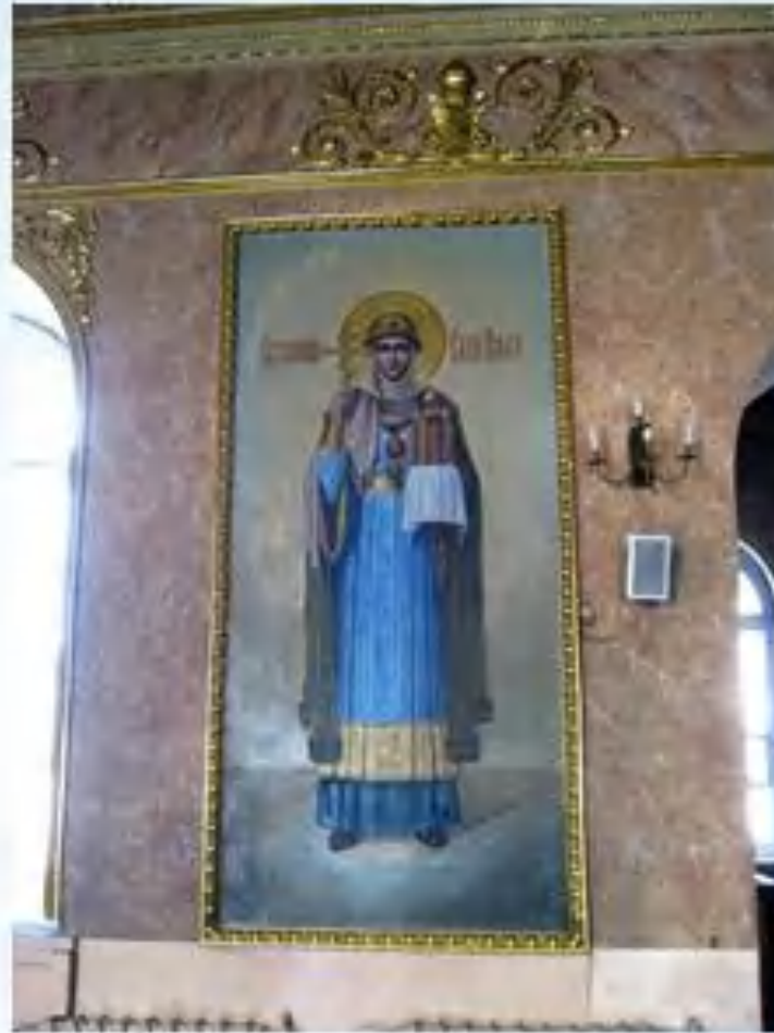
Спаский Староярмарочный собор