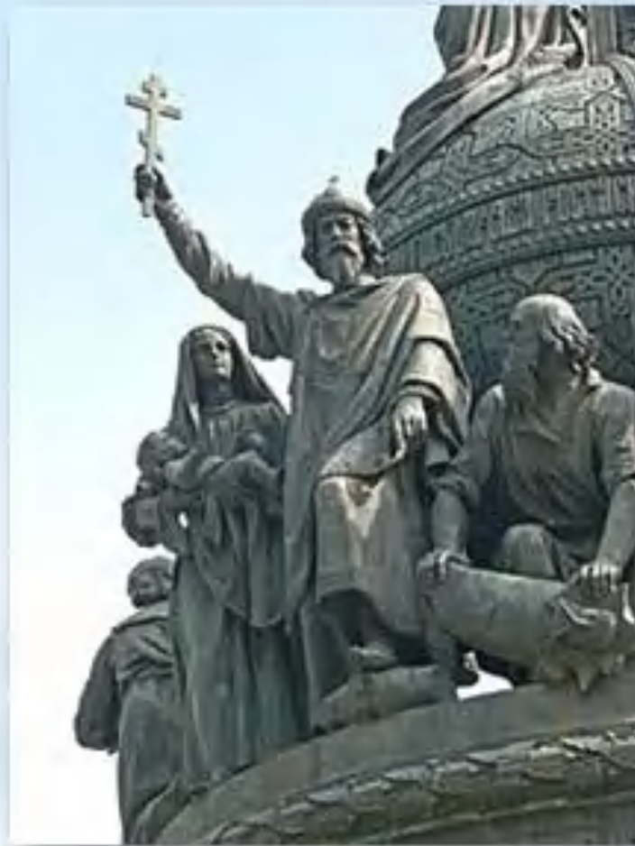
Памятник «Тысячелетие России» в Великом Новгороде