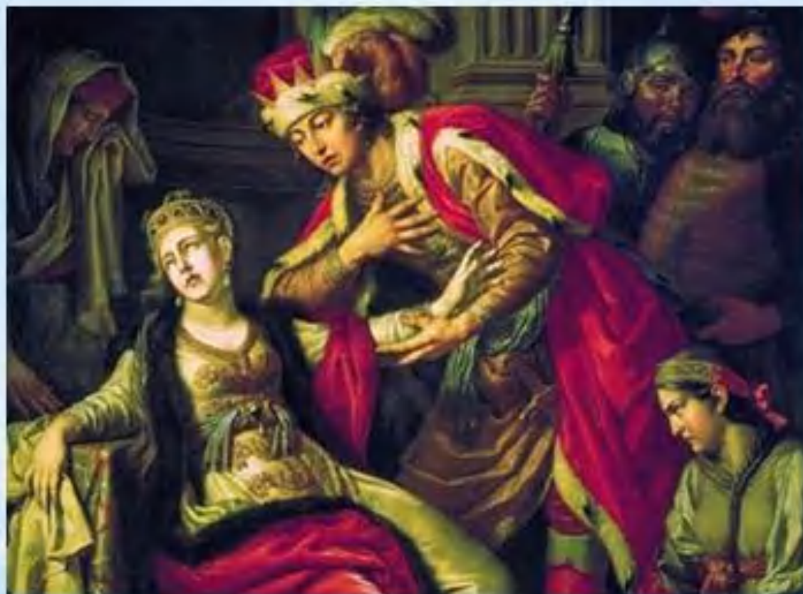
Владимир и Рогнеда