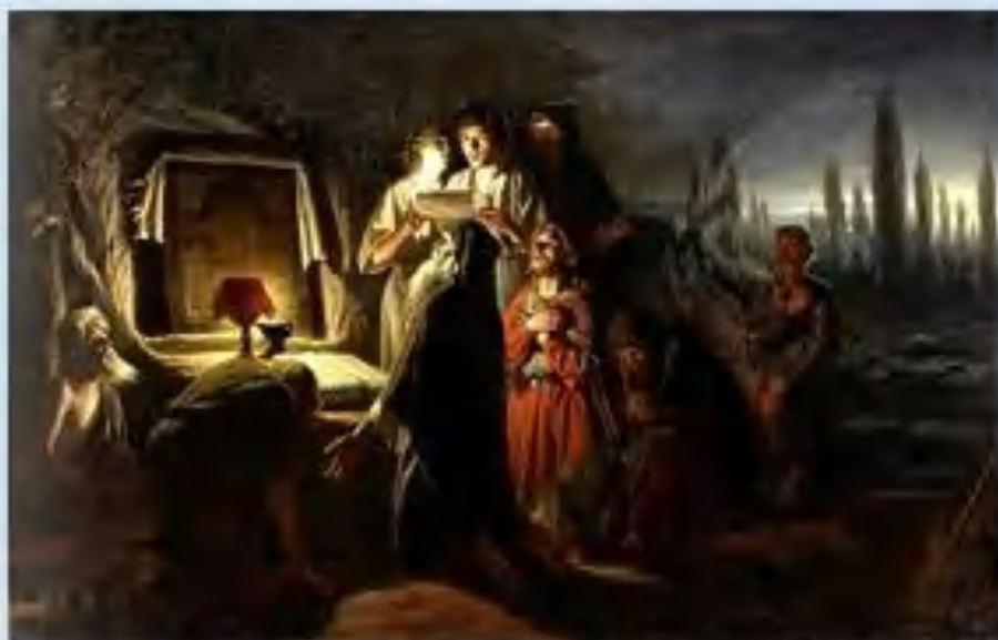
В. Перов. Первые христиане в Киеве

Крещение Руси принято относить к 998 году, это считается официальным началом русской православной церкви. Но задолго до этого события на Руси существовали православные храмы, а первые нательные кресты, найденные в захоронениях, относят к середине X века.