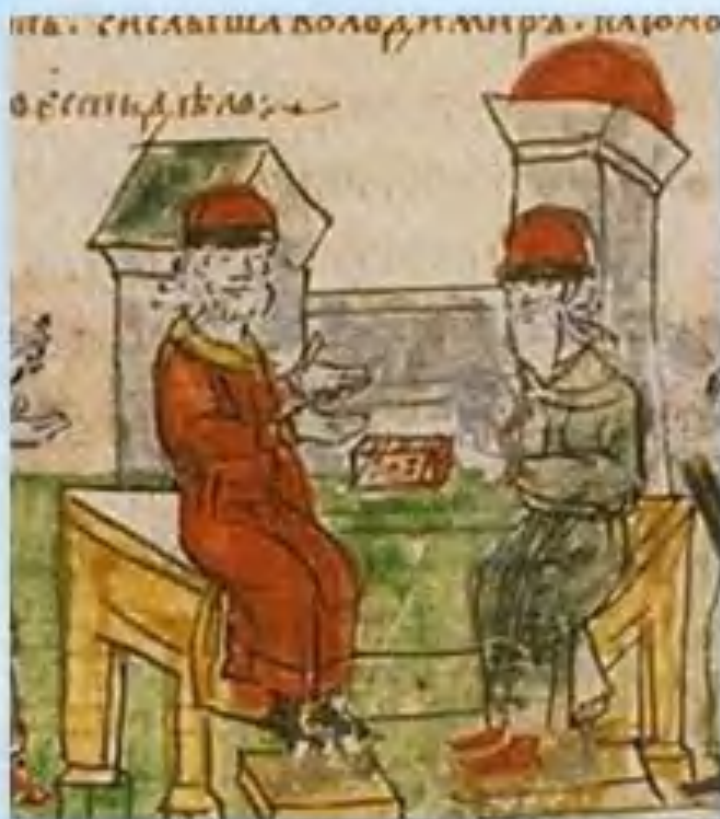
Беседа Владимира с греческим философом о христианстве. Радзивилловская летопись

Как свидетельствует «Повесть временных лет», перед крещением Владимир принимал послов волжских булгар, предлагавших ему принять ислам, миссионеров из Ватикана и хазарских евреев. Затем на Русь прибыл византиец, которого летописец за мудрость назвал Философом.