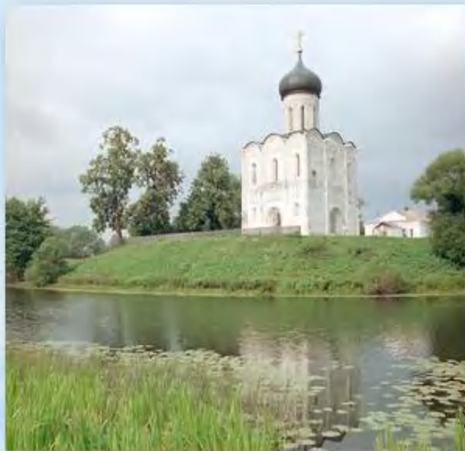
Церковь Покрова на Нерли