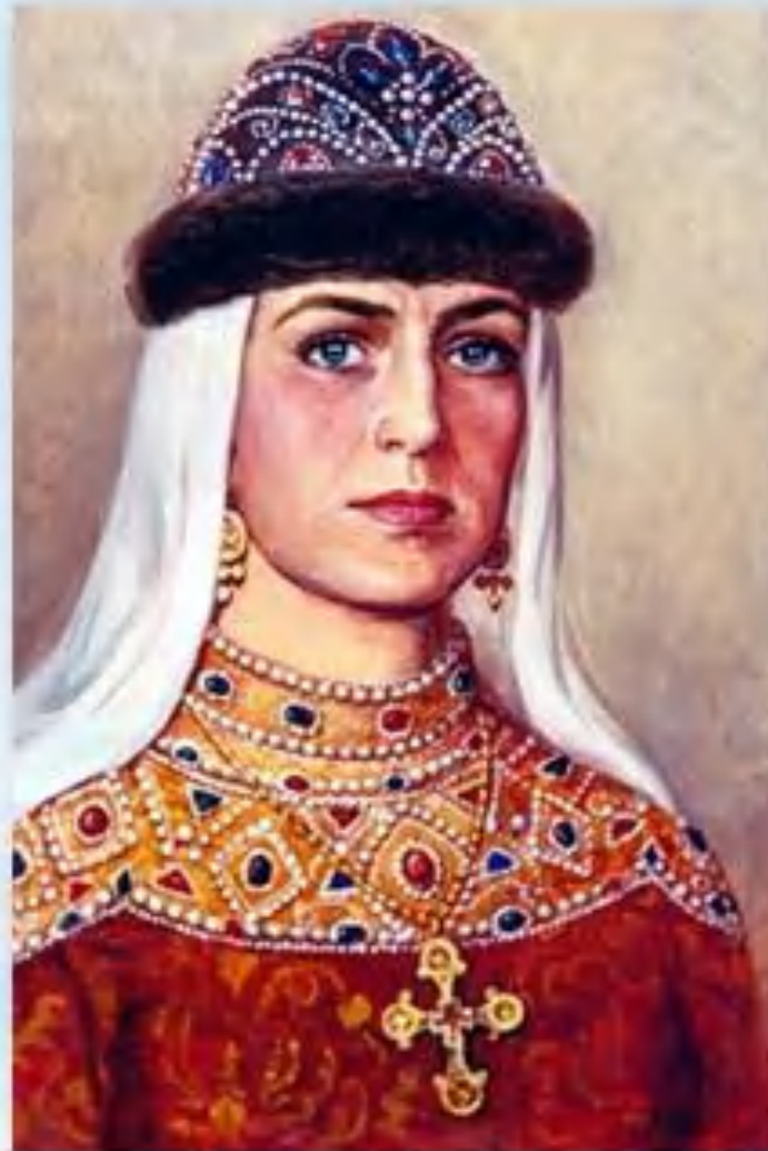
Великая княгиня Ольга