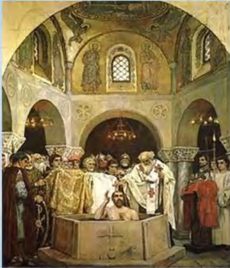
В. Васнецов. «Крещение князя Владимира»