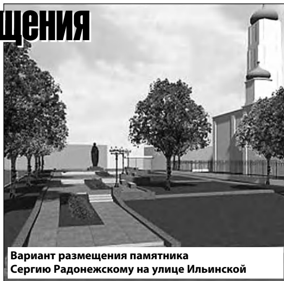
Вариант размещения памятника Сергию Радонежскому на улице Ильинской

«Эта территория находится в непосредственной близости к пешеходному мосту через Почаинский овраг, который связывает улицу Ильинскую с Университетским переулком. Здесь памятник гармонично вписывается в общую концепцию улицы Ильинской, между ансамблем Вознесенской церкви и памятником культуры федерального значения усадьбой Рябиной», — написал глава администрации в прошлом году.