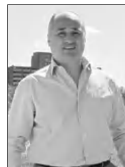
Подготовила КИРА СИДОРОВА

За время субботника было собрано более 200 мешков мусора.