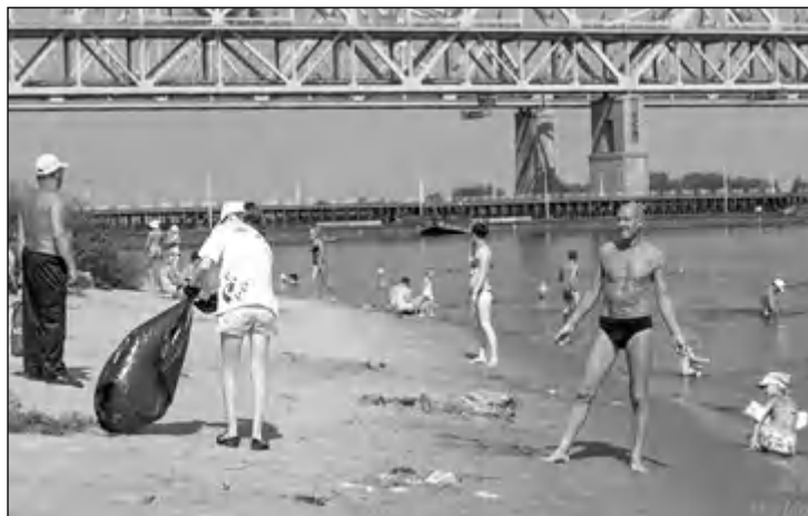
В минувшую субботу в Нижнем Новгороде прошла первая акция «AntiСВИН». Активные горожане убрали мусор, который оставляют после себя несознательные отдыхающие.

Проект «AntiСВИН» объединил людей, которые хотят жить в чистом городе, отдыхать на чистых берегах озер и рек. Сразу в двух зонах отдыха — на набережной Волги в микрорайоне Мещерское озеро и на Гребном канале — потрудились участники «AntiСВИНского» субботника.