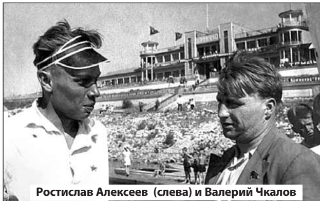
Ростислав Алексеев (слева) и Валерий Чкалов

В 1938 году 2-я Поволжская парусная регата состоялась в Горьком. В судействе участвовал Валерий Чкалов, который нашел время для посещения 16 июля открытия регаты на водной станции «Динамо».