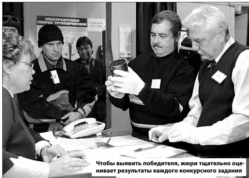
Чтобы выявить победителя, жюри тщательно оценивает результаты каждого конкурсного задания

ДАРЬЯ СМЫСЛОВА ФОТО ПРЕДОСТАВЛЕНЫ ОАО «ТЕПЛОЭНЕРГО» на правах рекламы