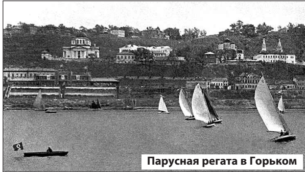
Парусная регата в Горьком

Первые соревнования по парусному спорту в нашем городе прошли летом 1929 года. В них участвовали шесть судов, 12 спортсменов. Соревнования проходили с пересадкой экипажей.