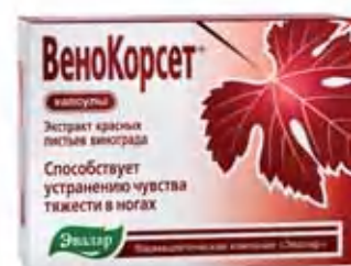
Капсулы Аналог импортных средств по доступной цене

* Если отеки не являются следствием заболевания.