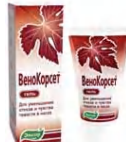
Гель Легко наносится и быстро впитывается

Для достижения максимального эффекта рекомендуется совместное применение напитка, капсул и геля.