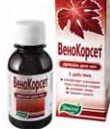
Дренажный напиток Напиток с приятным вкусом красного винограда