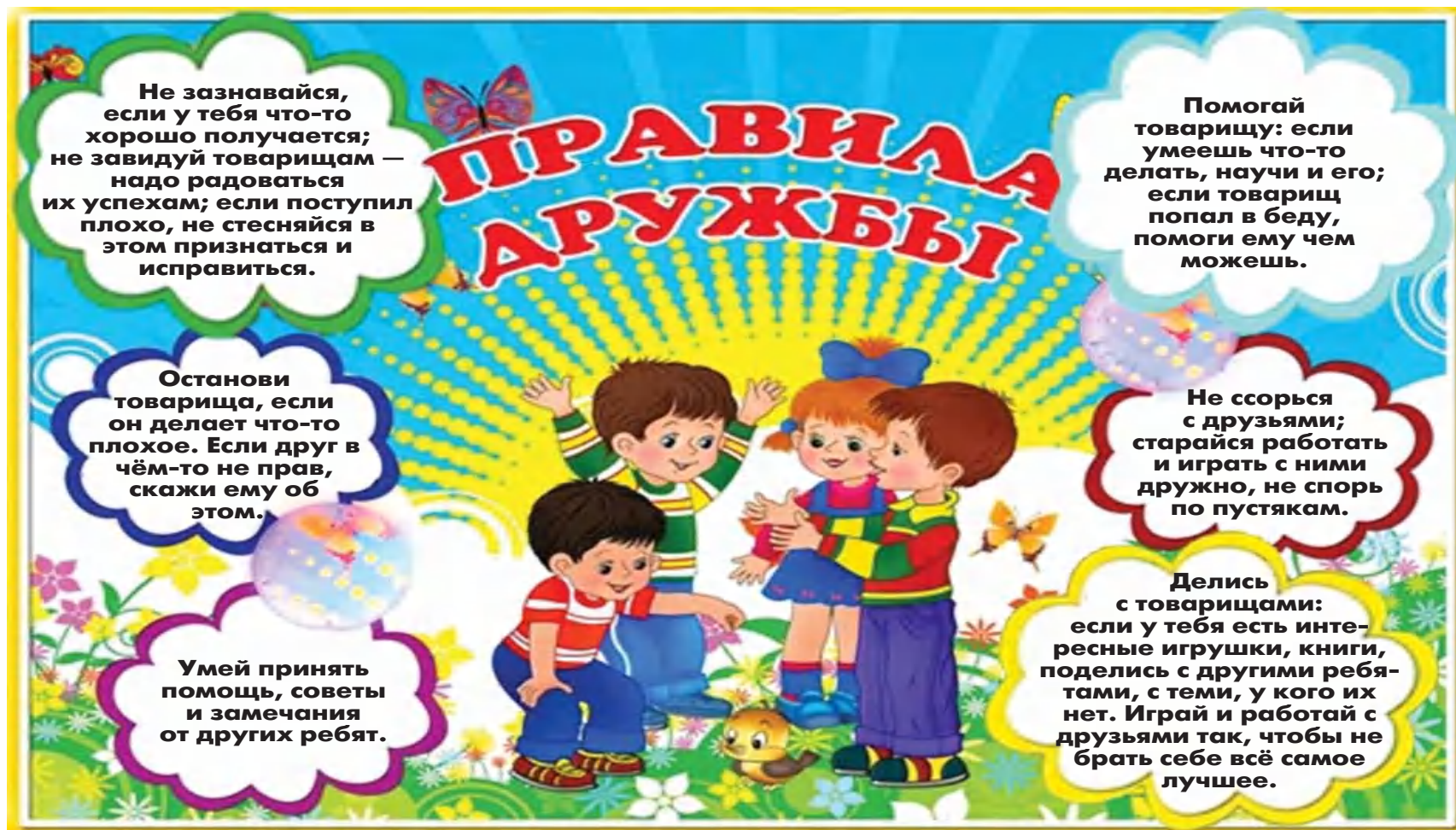
При поддержке департамента образования администрации Нижнего Новгорода. Материал подготовила Марина Сергеева.

— А вы попробуйте все вместе выучить правила дружбы и потом следовать им. Вот тогда наверняка вы станете настоящими друзьями! — посоветовала бабушка.