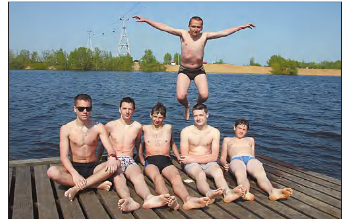
Идея Марины Горева.