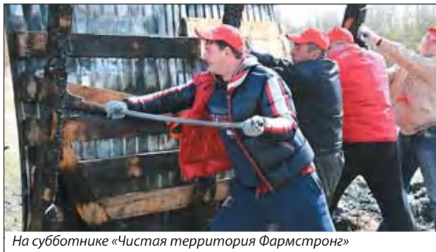
На субботнике «Чистая территория Фармстронг»