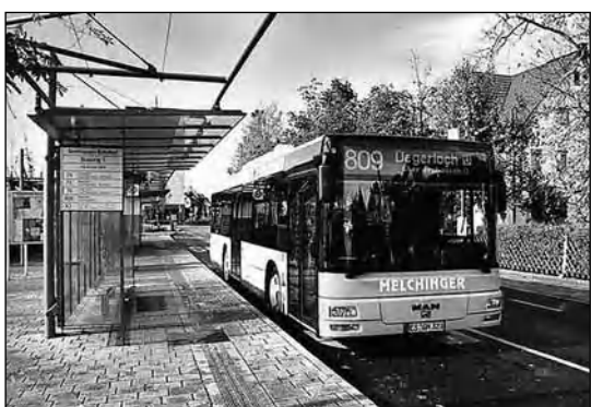
(Окончание. Начало в № 37, 39, 41, 43.)