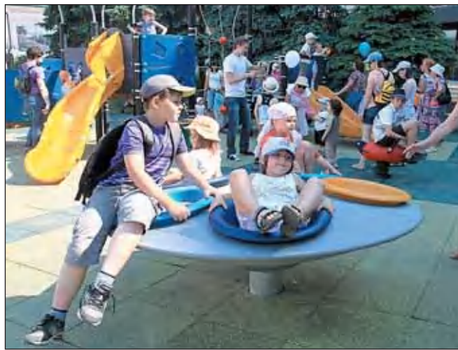
Продолжение. Начало на стр. 11

которое, кстати, выполнено из экологически чистых и устойчивых к повреждениям материалов, таких как сталь и полиэтилен высокой плотности. На всей территории детской площадки установлены прочные скамьи с удобными спинками, а также урны.