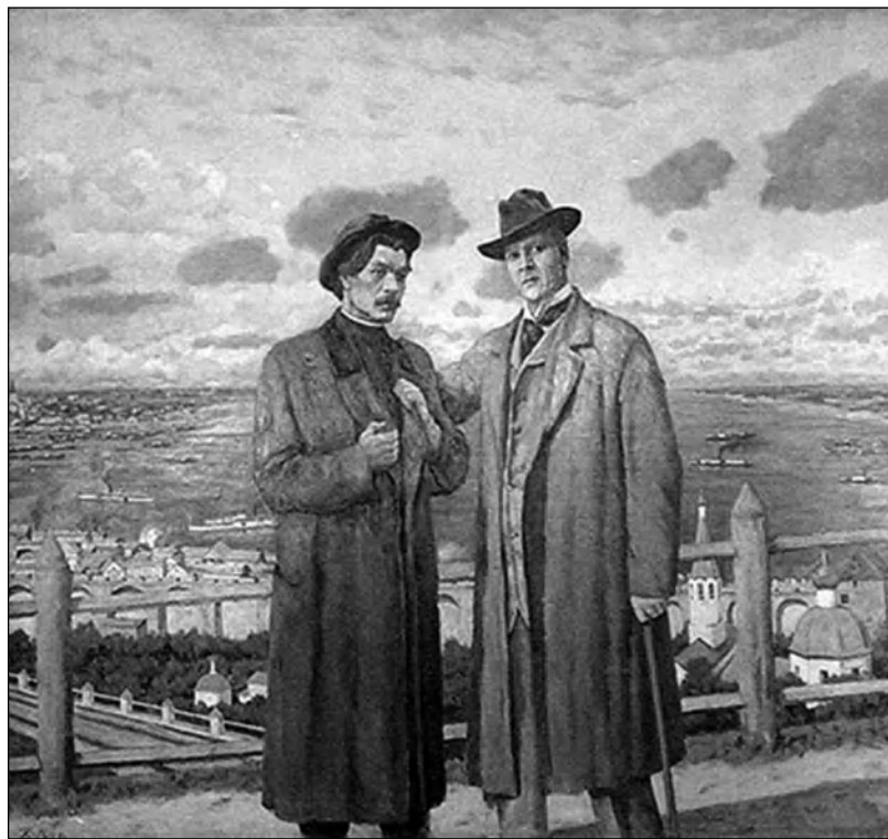
Иллюстрация из интернета

Отреставрированные полотна и книги займут свое место в обновленных экспозициях музея Максима Горького и вместе с другими экспонатами будут представлены гостям юбилейных мероприятий.