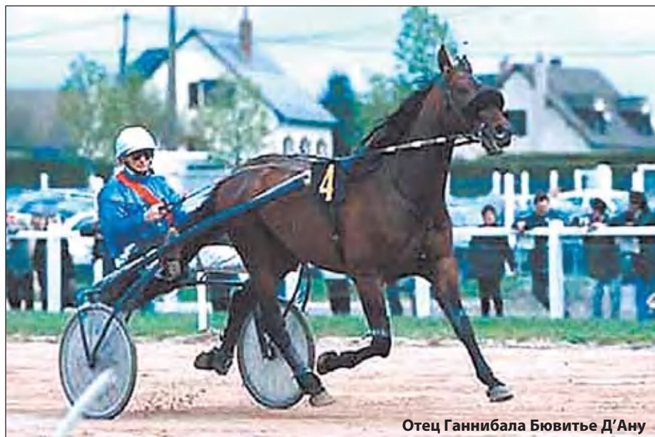
Отец Ганнибала Бювитель Д'Ану