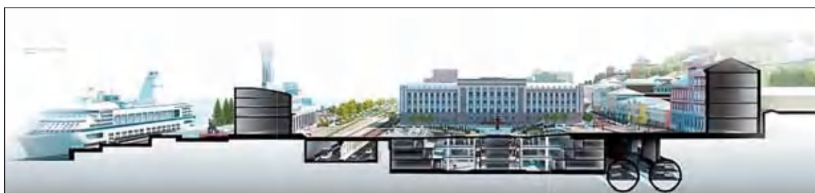
КОНЦЕПЦИЯ РЕКОНСТРУКЦИИ ПЛ. МАРКИНА (СОФОНОВСКОЙ)

При реконструкции площади предусматривается активное использование подземного пространства, непосредственно связанного с основными пешеходными потоками и подземной автостоянкой. Функциональное назначение общественной зоны площади — торговый центр с магазинами и кафе, заглубленный на три этажа по отношению к улице. Торговая площадь примыкает во втором уровне к подземному транспортному тоннелю с прямым выходом с остановки общественного транспорта. Благоустройство площади предполагает воссоздание исторически сложившейся в XIX веке при непосредственном участии Ф.А. Блинова композиции с установкой фонтана.