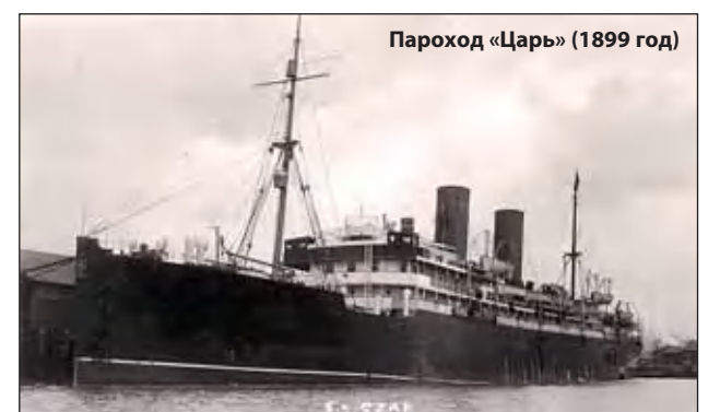
Пароход «Царь» (1899 год)