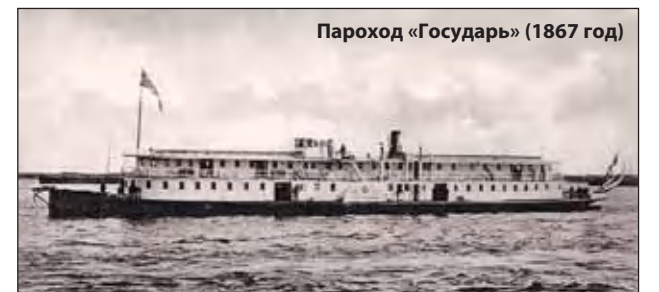
Пароход «Государь» (1867 год)

К 1900 году общество владело 23 пароходами, которые по своей конструкции, отделке и быстроте считались лучшими на Волге. К этому времени с Сормовской верфи сошли новые «Царь», «Царица», «Князь», «Княгиня», «Императрица». В 1904 году построены «Гражданка», «Княжна», «Боярышня», «Дворянка» и «Граф». С выходом в плавание всех новых пароходов общество «По