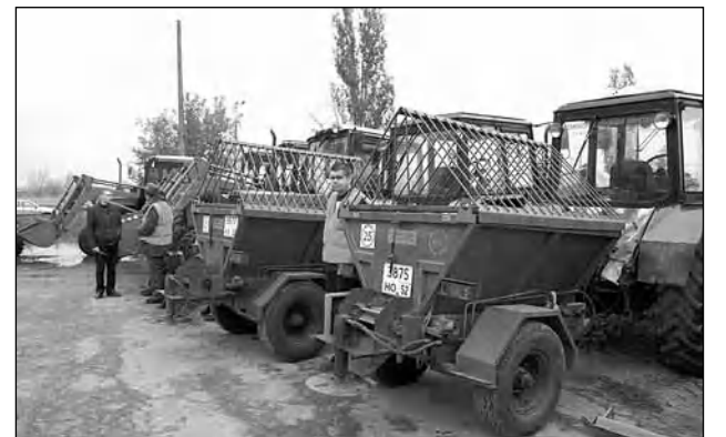
Материалы подготовила Светлана Муратова