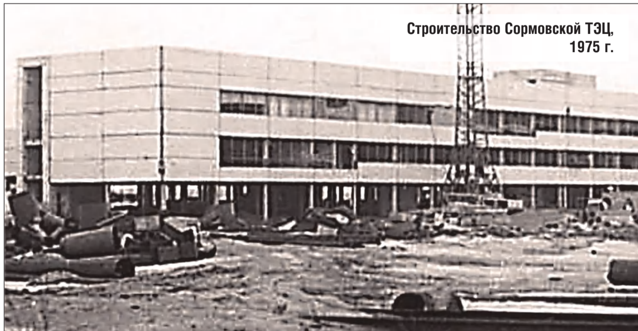
Строительство Сормовской ТЭЦ, 1975 г.