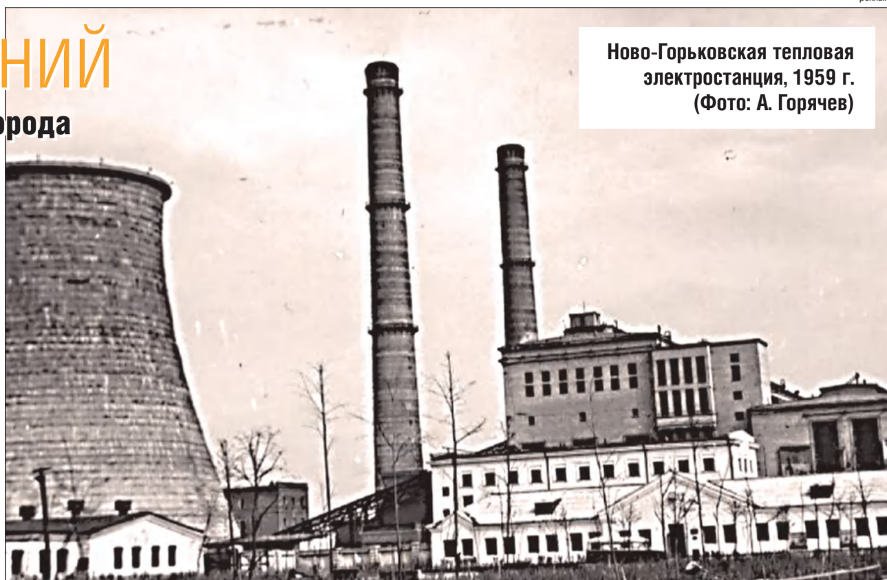
Ново-Горьковская тепловая электростанция, 1959 г.

Воплощая политику рационального распределения тепла, на тепловых сетях стали устанавливать специальные сужающие устройства. В 1987 г. впервые за последние годы после окончания отопительного сезона надежность сетей проверили высоким давлением. Результат оказался печальным: трубы рвались даже там, где вроде бы и не должны рваться. Зима того года стала настоящей проверкой идеи