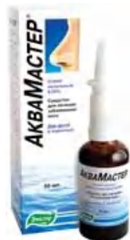
Для взрослых и детей

«Линия здоровья «Эвалар»: 8-800-200-52-52 (звонок бесплатный) 1 Бензалкония хлорид в дополнительном составе. ЛСР-006001/10. Реклама