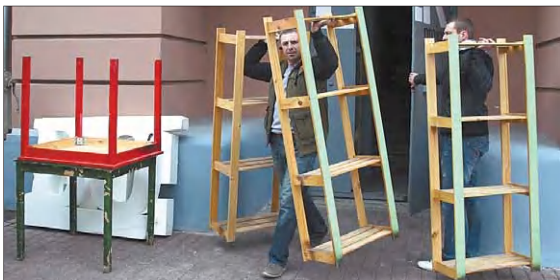
Идея Марины Сергеевой

И в старых книжных полках, которые выносят из офиса, тоже вряд ли кто спрятал сокровища. Впрочем, если руки вставлены тем концом и на то место, которое нужно, то любой уважающий себя мужчина сделает из старого хлама конфетку!